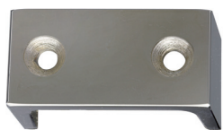
Stahlkloben in Nickel poliert und Messing poliert