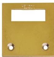
Bodenschließblech in Ni u. Ms

Die elegante Zweipunktverriegelung, das ZPV nach Maß von Helason bietet einen optimalen Einbruchschutz für ein- und zweiflügelige Türen. Das ZPV wird exakt nach Maß gefertigt , d.h. individuell an die Türmaße angepasst. Es eignet sich hervorragend zur nachträglichen Absicherung sowohl im Alt- als auch im Neubaubereich. Das Helason ZPV nach Maß besteht aus einem speziell angefertigten Aluminiumprofil in dem zwei massive Stahlriegel durch einen Einbaudoppelzylinder mit Zahnritzel betätigt werden. Der obere Stahlriegel sperrt 62 mm in einen Stahlkloben und der untere Stahlriegel 62 mm in ein am Boden montiertes Schließblech. Der Zylinder wird durch eine speziell gehärtete Sicherheitsrosette , die von innen mit dem ZPV verschraubt ist, geschützt. Das moderne ZPV nach Maß kann mit jedem handelsüblichen Schutzbeschlag kombiniert werden, ist in jede Schließanlage integrierbar und in allen RAL-Farben bzw. in diversen Eloxalfarben lieferbar.