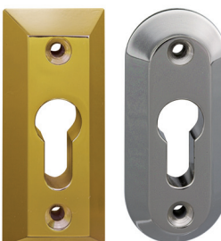
Innenrosette in Ni pol., Ms pol. bzw. lackiert. (eckig oder oval)

Sicherheitsrosette aus hochwertigem Werkzeugstahl gefräst und gehärtet. Oberfläche in Ni pol., Ni matt und Ms pol. erhältlich. Rosette mit oder ohne Kernziehschutz lieferbar. Der Kernziehschutz erschwert durch eine eingelegte Stahlplatte das Ziehen des Zylinderkerns.